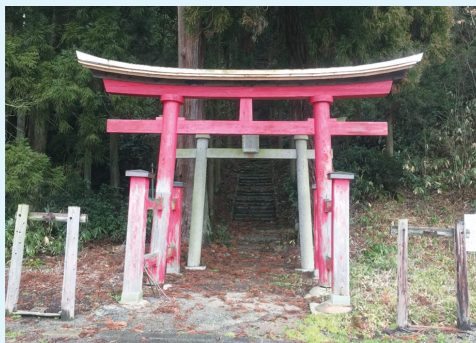
藤戸神社 新発田市東宮内